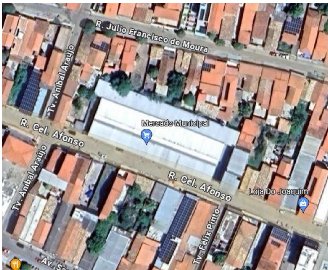
Figura 2: Mercado Municipal de Santa Rita de Cassia