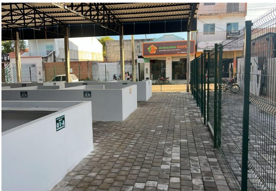
Figura 6: Área dos boxes a se colocar o revestimento cerâmico.