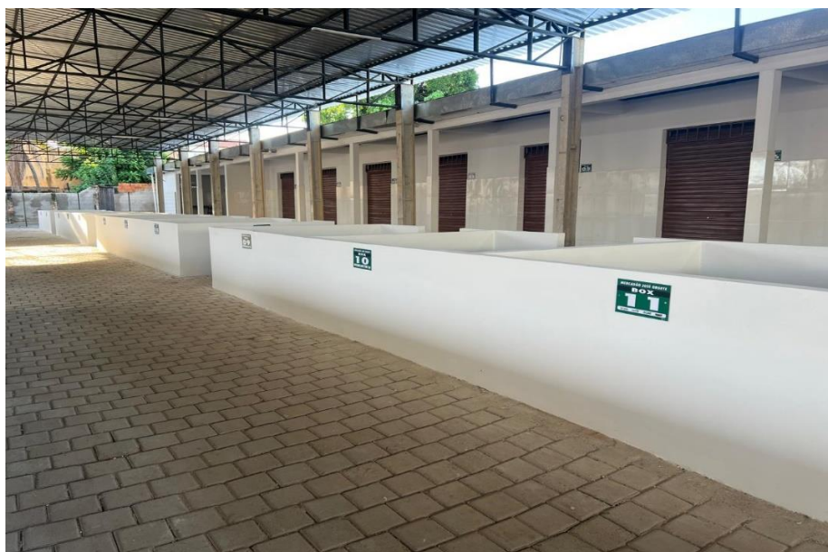
Figura 5: Área dos boxes a se colocar o revestimento cerâmico.