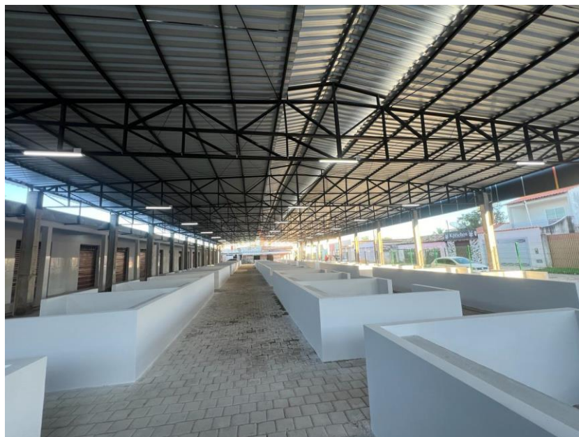
Figura 3: Área dos boxes a se colocar o revestimento cerâmico.