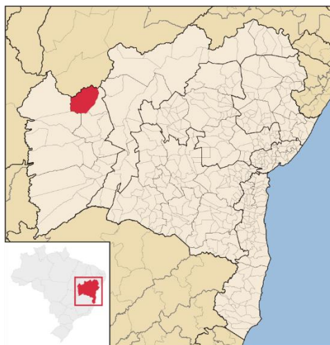
Figura 1: Mapa de situação

Visando a representação do local, a Figura 1 ilustra o município a qual a obra vai contemplar.